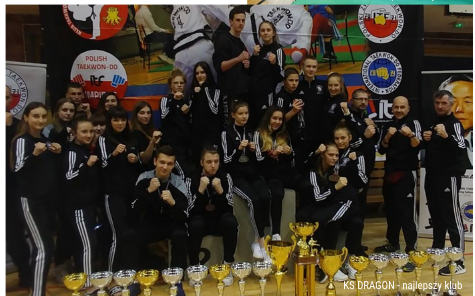
KS DRAGON - najlepszy klub